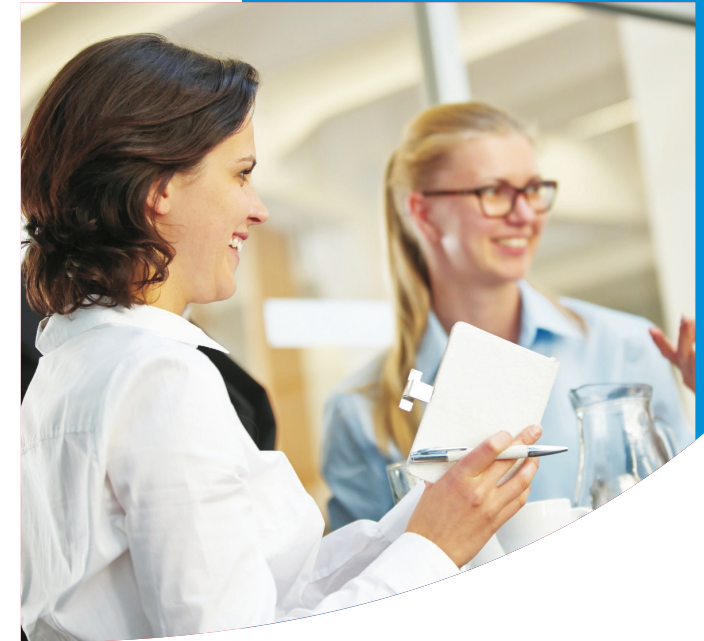
00_F_251125_7_Marktplatz Gute Geschäfte